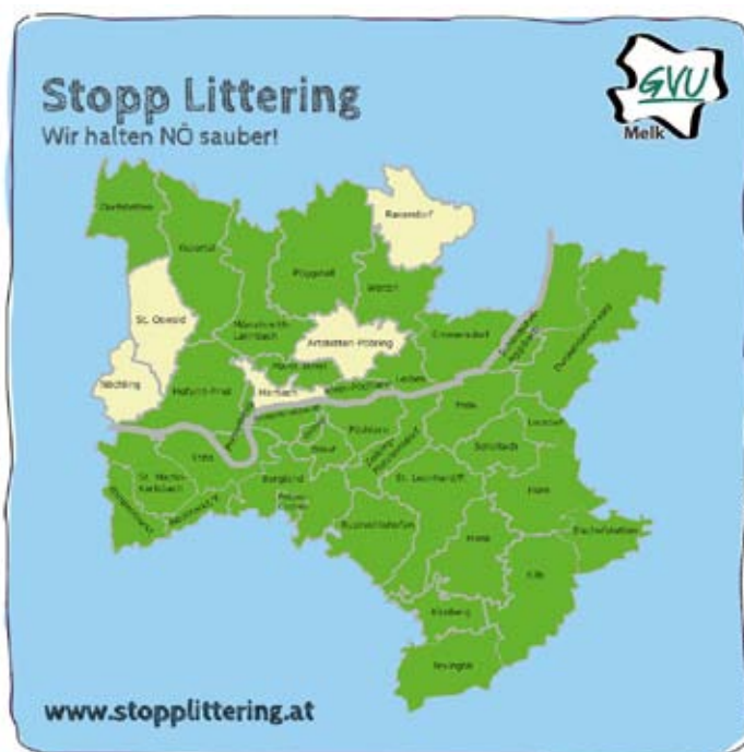
Auch heuer konnten wir große Teile des Bezirkes mit Sammelaktionen abdecken

Wir bedanken uns herzlich für das rege Interesse und die Teilnahme! Auch im kommenden Jahr unterstützen wir wieder gerne alle Sammlungen mit Handschuhen, Warnwesten und Sammelsäcken! Berichte und Fotos von den Sammlungen finden Sie auch auf www.stopplittering.at