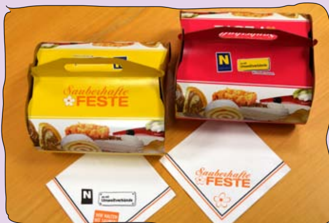
Die neuen Kuchenboxen aus Karton

Wer Feste feiert wie sie fallen, möchte das auch ohne nervigen Verlust von Speis' und Trank tun können. Die Einwegbecher und -teller sind dabei nicht nur sehr instabil, sondern beeinflussen auch den Geschmack und sorgen für ein „billiges Ambiente“. Von den großen Mengen an Abfall, die dabei entstehen, ganz zu schweigen!