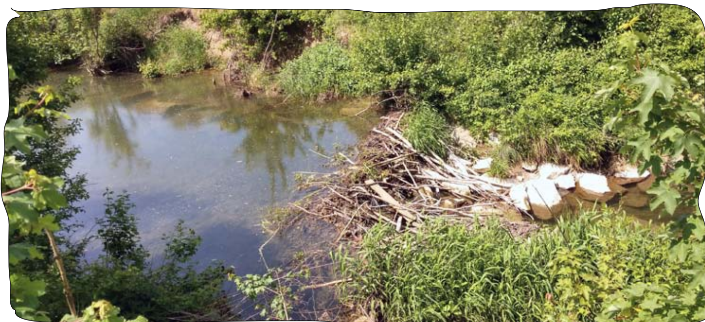
Ansammlung von Treibgut, kann ganze Bachläufe verstopfen und Bäche über die Ufer treten lassen

„Wir wissen durch Pro-Office genau, wann der Wildbachbegeher welchen Übelstand aufgenommen hat, welches Bauwerk besichtigt und welche Schäden festgestellt wurden. Heute werden die Schreiben mit den Aufforderungen zur Behebung der Missstände an die Grundstückseigentümer inklusive Fotos auf Knopfdruck generiert.“