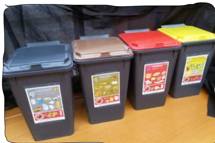
Eine funktionierende Mülltrennung ist Grundvoraussetzung für die Abfallwirtschaft

Abfallwirtschaft ist ein Thema das uns alle angeht und bei dem jeder von uns seinen Teil dazu beitragen kann!