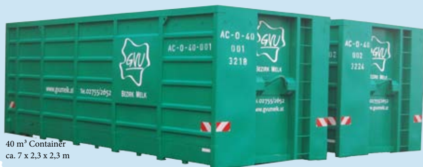
40 m 3 Container ca. 7 x 2,3 x 2,3 m

Manchmal hat man größere Mengen an Abfall, vor deren Entsorgung man sich jahrelang drückt. Zeit ist oft ein ausschlaggebender Grund um ein Räumungs- oder Umbauprojekt wieder einmal auf das kommende Jahr zu verschieben.