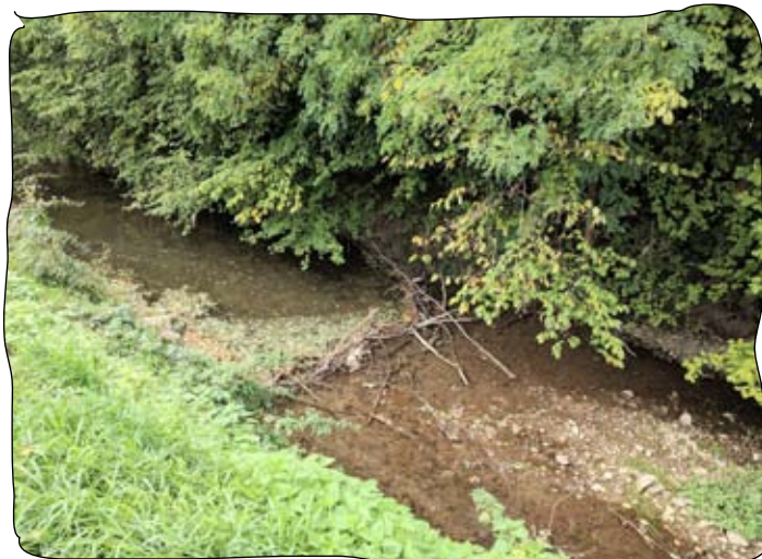
Treibgut kann einen Bach bei Sturzregen schnell über die Ufer treten lassen!

Die im Forstgesetz geregelte Auflage einer jährlichen Begehung der Wildbäche gewinnt durch immer extremer werdende Wetterverhältnisse und klimatische Veränderungen an Aktualität und Dringlichkeit. Zur Schadensprävention ist nicht nur die Überprüfung